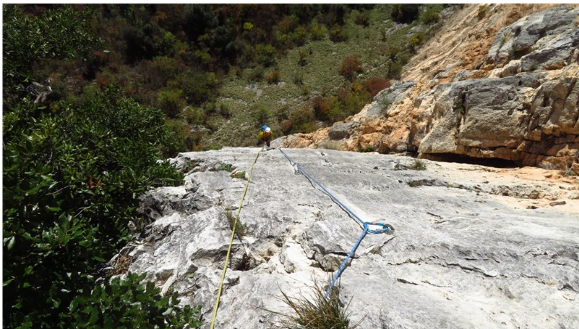
Il muro finale della quinta lunghezza