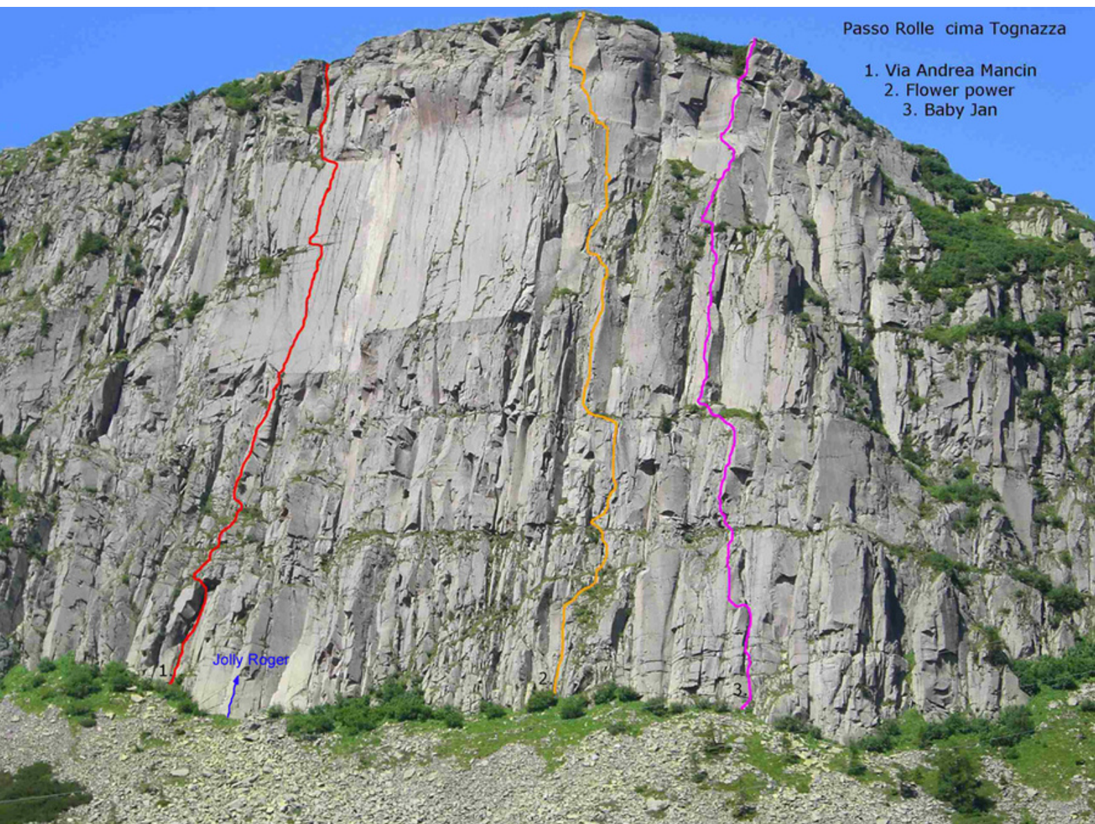
Passo Rolle cima Tognazza