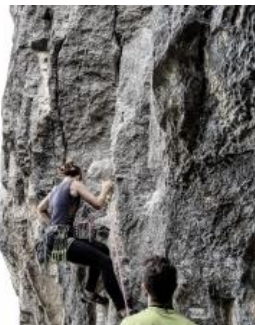
Parete Martina https://avevolevertigini.com/